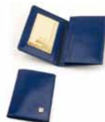
Wizytownik skórzany 002W