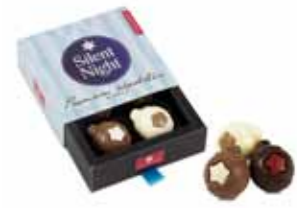
Filled xmas balls