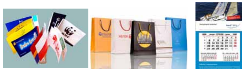
Zawsze modne chorągiewki papierowe