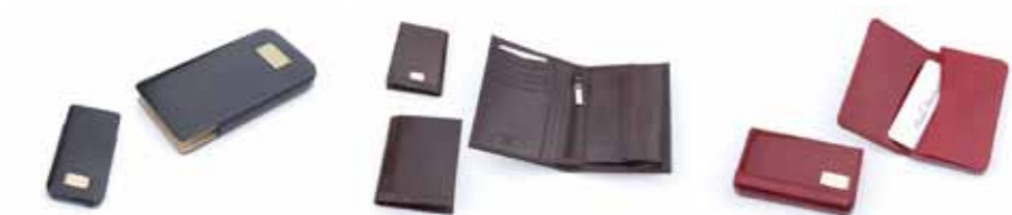
Etui na telefon Paolo Bantacci 290E