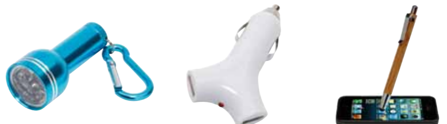
Mini latarka CARA z karabińczykiem