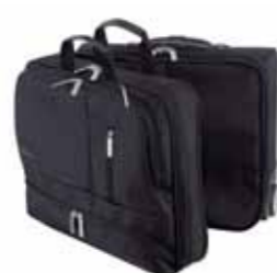
Biznesowa walizka „Frankfurt”