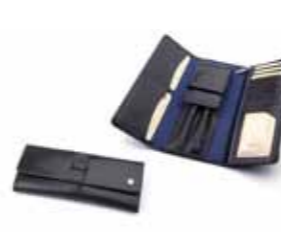
Etui skórzane 130E