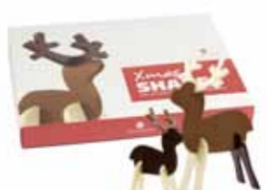
Xmas Reindeers 3D