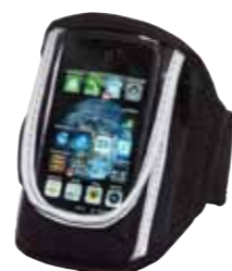
Pokrowiec na telefon komórkowy „Smart run”