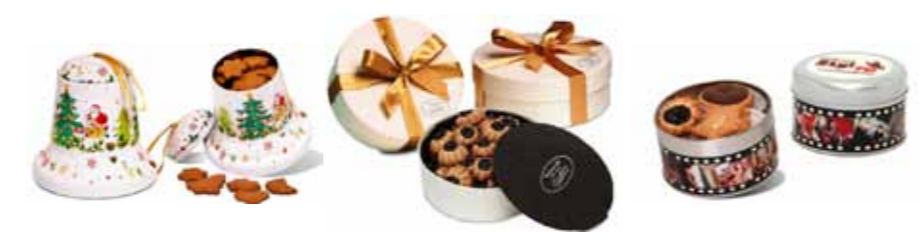
Ciasteczka Dzwonek Ciasteczka Gwiazdki Ciasteczka Mix