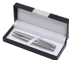
Zestaw do pisania „Chromium”