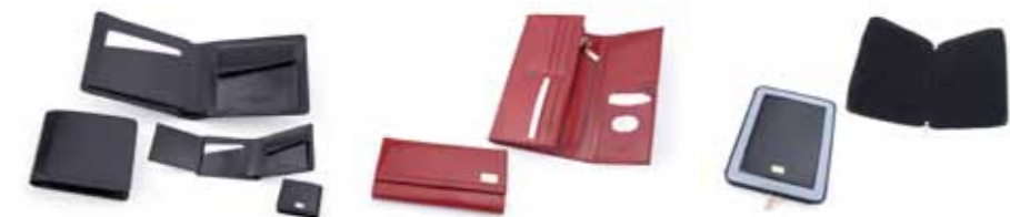
Portfel skórzany Paolo Bantacci PB-10