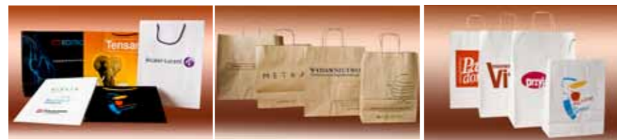
Duże torby firmowe klasy LUX