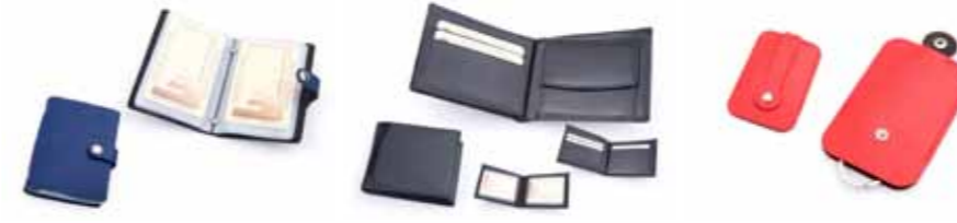
Wizytownik Mio Gusto 232W/A