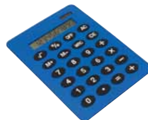
Kalkulator BUDDY w formacie A4