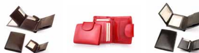
Portfel skórzany Mio Gusto 220M/A

Portfele, teczki, wizytowniki, etui, kosmetyczki