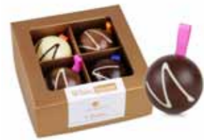
Bombka z mlecznej czekolady

Upominki firmowe, Gadżety firmowe, Upominki korporacyjne, Czekoladki personalizowane, Prezenty firmowe, Upominki dla biznesu, Personalizowane prezenty czekoladowe, Świąteczne kosze firmowe