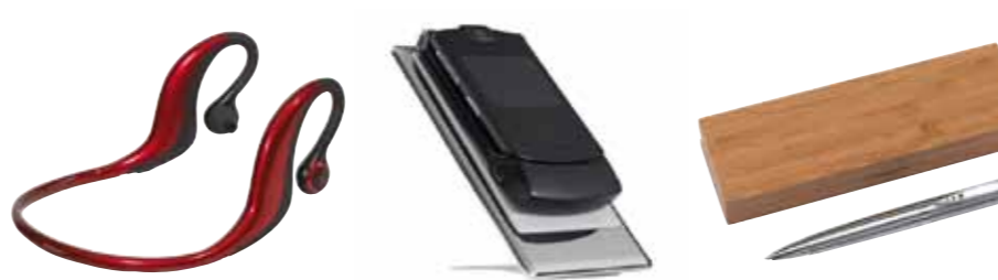
Bezprzewodowe słuchawki FREESPORT