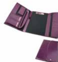
Aktówka skórzana 208-OK