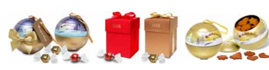
Bombki Lindor Bombonierka Tower Ciasteczka Bombka

Słodycze reklamowe, słodkie upominki, opakowania prezentowe, zestawy upominkowe, projekty i konstrukcje opakowań, gadżety reklamowe, Słodycze reklamowe, czekoladki reklamowe