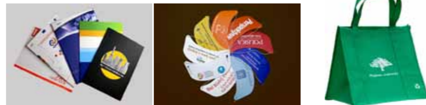
Indywidualne teczki na dokumenty