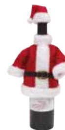
Świąteczny pokrowiec na butelkę „God Jull”