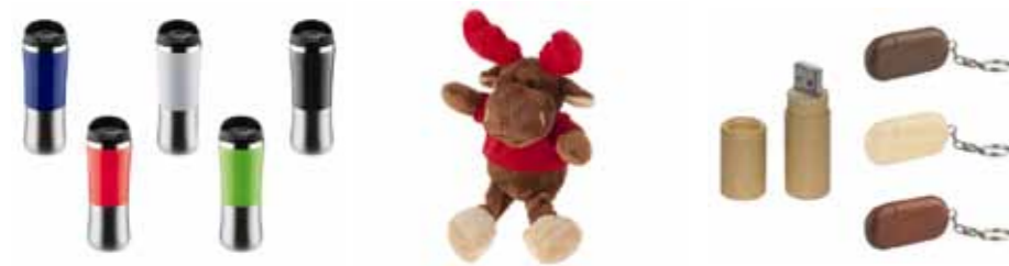
KUBKI TERMICZNE MASKOTKI BRELOKI USB