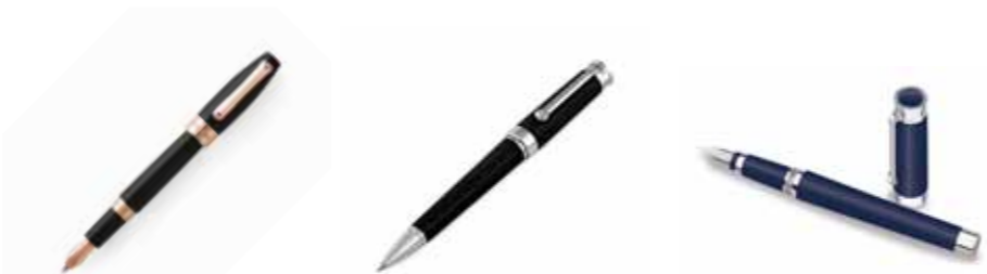
Pióro wieczne Montegrappa Fortuna platerowane różowym złotem