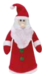
Figurka z włókny „Sinterklaas”