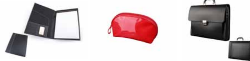
Okładka Mio Gusto 253-0K/A