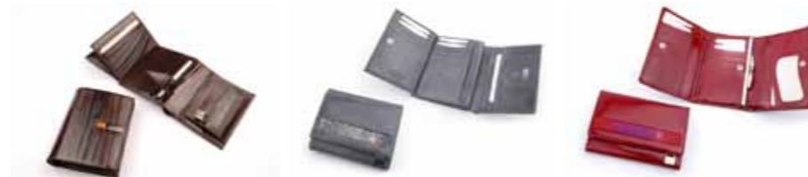
Portfel skórzany Giovani AV-101