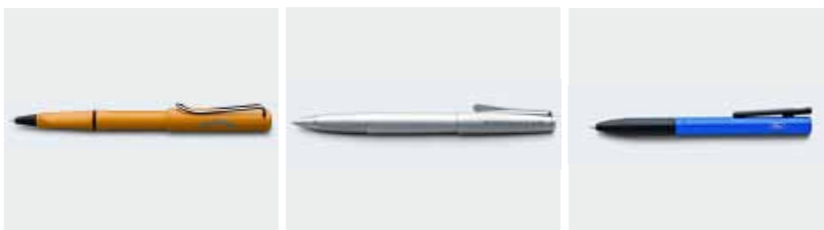
Pióro kulkowe Lamy Safari złote. Design: Wolfgang Fabian