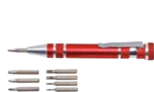
Zestaw bitów, czerwony „Micro”