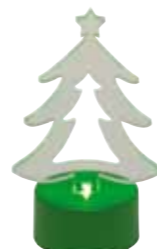
Lampka LED „Xmas tree”