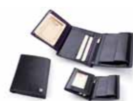
Portfel skórzany 001m

Portfele, teczki, torebki, wizytowniki, etui, aktówki, paski, kluczówki