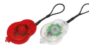
Latarka USB „Flexi”