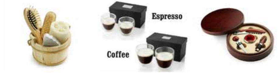
ZESTAWY UPOMINKOWE ZESTAWY DO KAWY I ESPRESSO ZESTAWY DO WIN