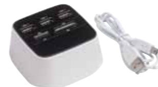
Uniwersalny czytnik kart MAGIC CUBE