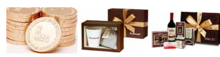
Dukaty Kawa kubek Zestaw SKD-0014