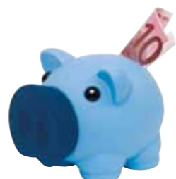
Skarbonka „Money Collector”, niebieska