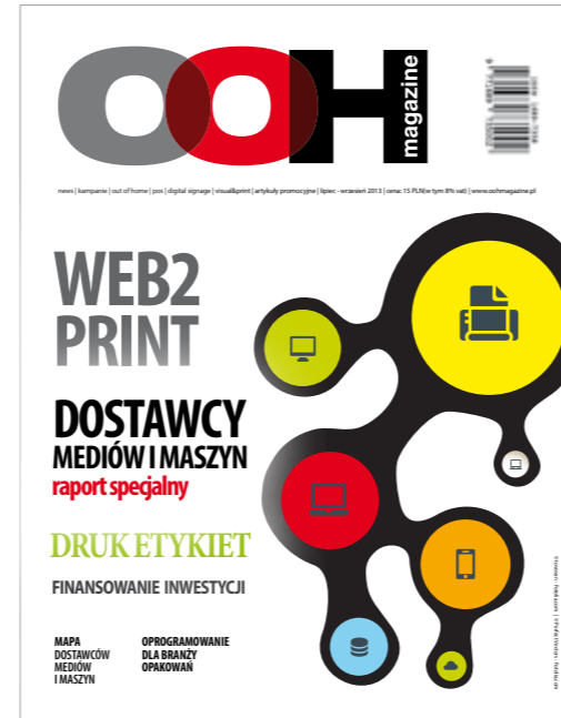
Jedyny na rynku Raport Dostawców Mediów i Maszyn