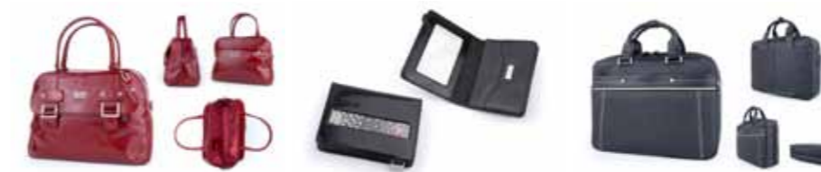
Torba skórzana Giovani LC-600