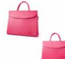
Torba skórzana B-394