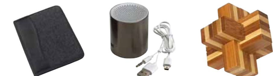
Filcowe portfolio EMINENCE