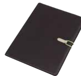
Portfolio „Session”, format A4