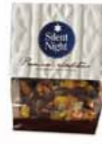
Extreme Mini Imbir&kokos