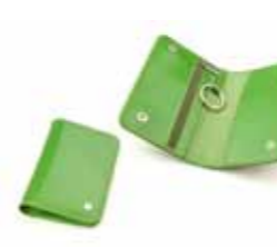
Kluczówka skórzana 019W