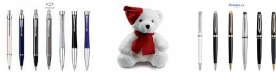
PARKER MASKOTKI WATERMAN

Smycze, kubki, długopisy, zakreślacze, Parker, Waterman, zestawy do win, usb, maskotki, breloki, opski silikonowe, kubki termiczne, szarfy, notesy, wizytowniki, teczki, plecaki, smycze