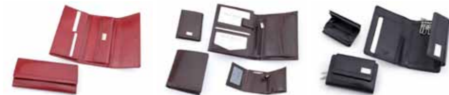
Portfel skórzany Paolo Bantacci PB-01