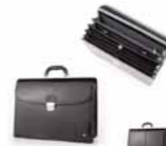
Teczka skórzana B-809