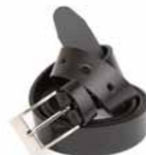
Pasek skórzany 00/30