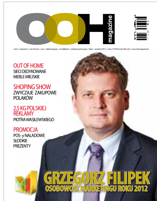
Magazyn o szeroko pojętej reklamie