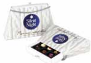
Winter pralinette - torebka