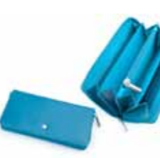
Portfel Skórzany 172D/K