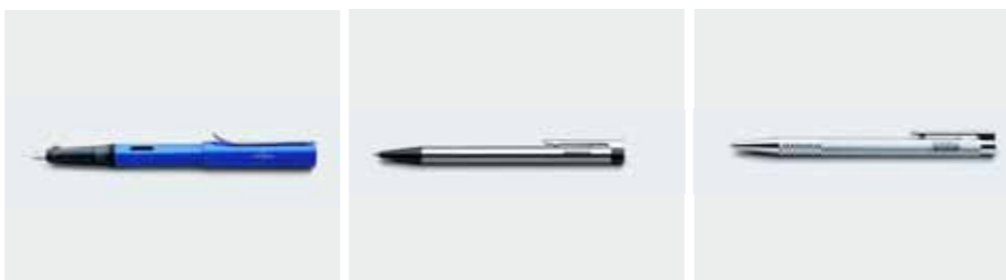
Pióro wieczne Lamy AL-star granat. Design: Wolfgang Fabian