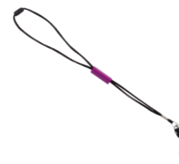
Smycz „Tri Key”