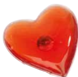
Podgrzewacz do rąk „Warm hearted”