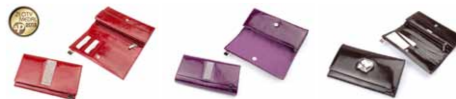
Portfel skórzany Giovani CV-240